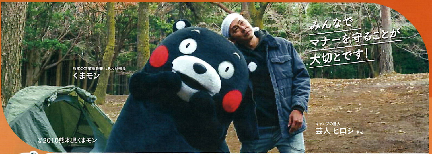
熊本の営業部長兼しあわせ部長 くまモン